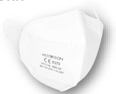
Talla única adulto

Uso previsto: Proteger de la inhalación de aerosoles, sólidos y líquidos a la persona que la lleva puesta.